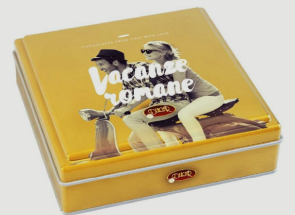
SCATOLE IN LATTA - modelli assortiti con cioccolatini