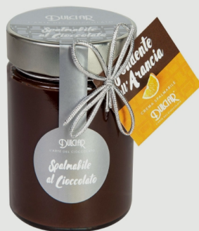
CREME SPALMABILI Gusti Assortiti 350 g