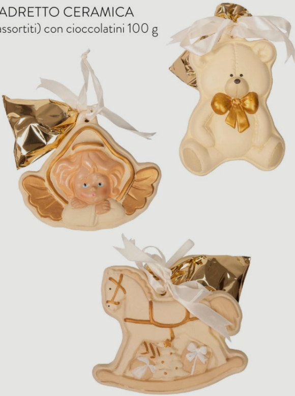
QUADRETTO CERAMICA (segni assortiti) con cioccolatini 100 g