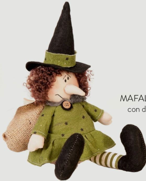
MAFALDA befana in pezza con dolci assortiti 150 g